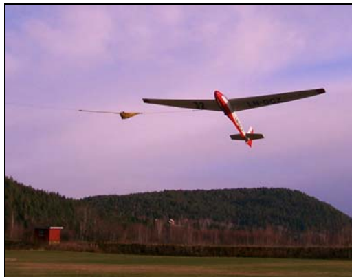
K8b, LN-GCZ i vinsjstart på Lunde

Styret i Seilflyhistorisk Forening har vedtatt at det skal etableres 4 arbeidsgrupper. Arbeidsgruppene skal ha hver sin ansvarlige leder. De fire gruppene arbeider innenfor følgende: 1. Markedsføring/rekruttering, 2. Historie, 3. Utdanning og 4. Teknisk. Det blir spennende å se hva gruppene får til fremover. Arbeidsgruppene er åpne for alle.