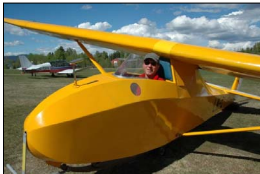
Grunau Baby 2b LN-GTI

I løpet av sesongen 2007 har Seilflyhistorisk Forening mottatt ikke mindre enn 4 stk. veteranseilfly. Denne artikkelen presenterer de ulike flytypene.