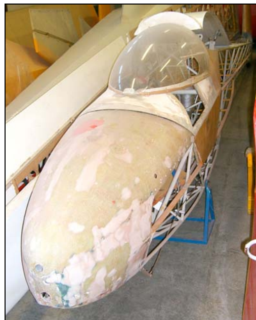
Ka 8b LN-GEM i Fredrikstad

Flyet ble bygget i Tyskland av: F. Eichelsdörfer, Bamberg/LVS Borken Byggeår: 1963 Byggenummer: 151