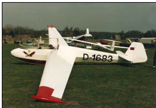
Bergfalke II/55 LN-GIL med tysk registrering

Flyet er bygget i Tyskland av: Lehrwerkstatt Messerschmitt AG, Augsburg Byggeår: 1961 Byggenummer: 3