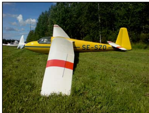
Ka6 CR på Ødestugu ved Jönköping

vingedroppen og tok rett av. Han kom tilbake med samme "fra øre til øre smil". Det ble med oss to, men vi var da meget fornøyd med dagen. På Ålleberg hadde det også blitt litt flyging den dagen.