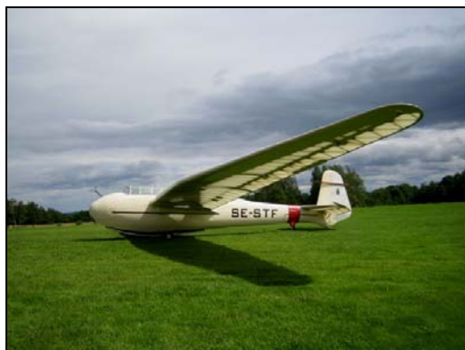
Kranich II, SE-STF på Ålleberg

For 6 år siden var foreningen en liten eksklusiv gruppe på så vidt over 10 medlemmer. Noen av medlemmene i foreningen satte seg som mål å øke interessen for veteranseilfly og norsk seilflyhistorie. Vi prøvde å tenke nytt. Et av målene var å etablere et medlemsblad. Et annet var å anskaffe et luftdyktig veteranseilfly som vi kunne demonstrere rundt på de ulike flyplassene i Norge. Siden dette har økningen både med hensyn til aktiviteter og nye medlemmer vært formidabel. De siste årene har vel klubben hatt den største prosentvise veksten av medlemmer i Norge. Seilflyhistorisk Forening er nå også registrert som en egen organisasjon i Brønnøysundregisteret.