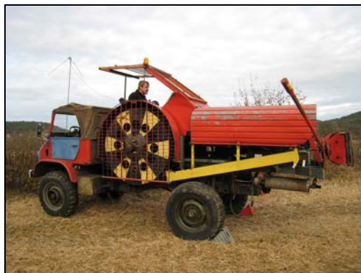
Vinsjen "Himmelvogna" på Lunde

Som kjent er SHF eier av en seilflyvinsj. Dette er en vinsj som ble bygget av LSV "Glückvogel" i Tyskland. Vinsjen ble bygget i 1967 men senere modifisert med blant annet en ny og større motor. Den er utstyrt med 2 tromler og en Opel Diplomatmotor på 230 hk. Vinsjen ble brukt i Tyskland frem til 1990 da den blir solgt til Danmark. I desember 1996 blir den så solgt til Norge (Jeløy Seilflyklubb) og var i flere år i bruk på Näsinge.