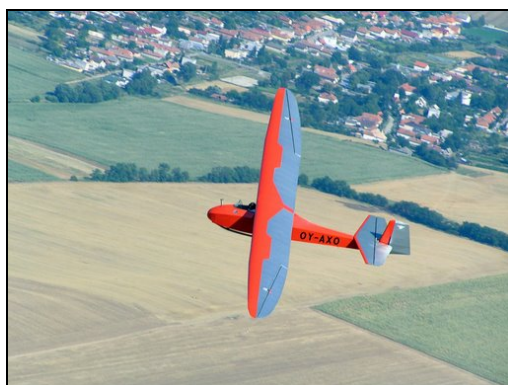
Dansk Grunau Baby 2 i luften over Nitra (aeroclub Nitra)

For de som er interessert i veteranseilfly er dette en stor opplevelse. Det anbefales absolutt og sette av tid til dette. Her er det masse spennende opplevelser for både flyinteresserte, piloter og familie.