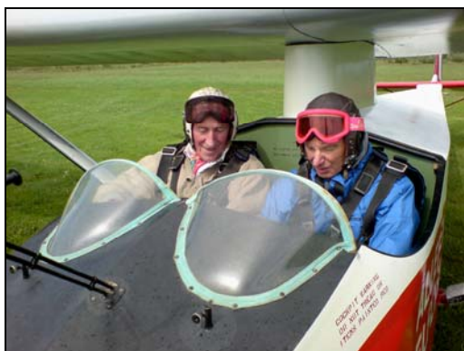
Svenske veteraner i Slingsby T-21