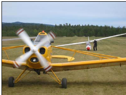
Piper Pawnee klar for slep med Lehrmeister