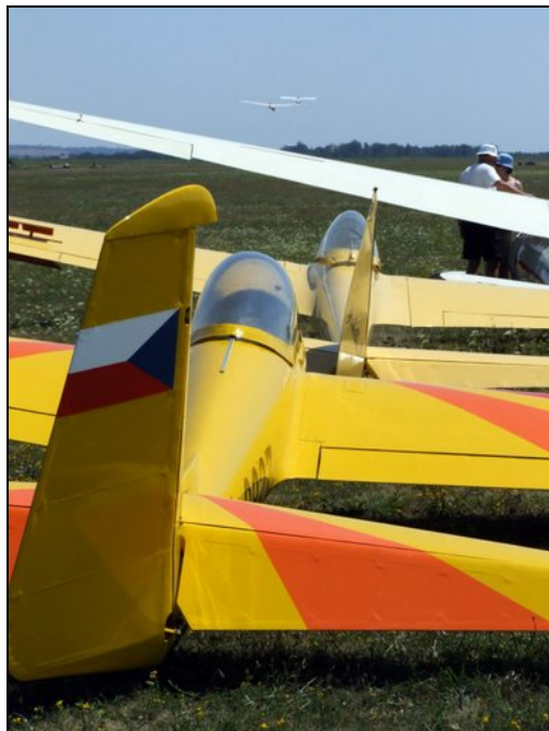
Tsjekiske Lunak i slepekø (aeroclub Nitra)

Hver sommer avholder Vintage Glider Club internasjonalt veteranseilflytreff rundt om i Europa. Sommeren 2007 ble det 35 internasjonale treffet avholdt i perioden 25. juli til 5. august i Nitra, Slovakia. Dessverre var det uten deltakelse fra SHF. Dette er relativt store arrangement med over 500 deltagere fra ca 25 nasjoner og totalt ca 100 fly.