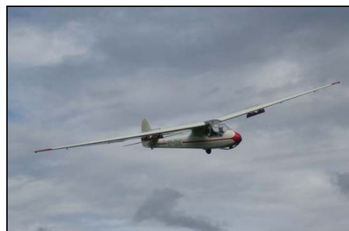
Lehrmeister på finale, Ålleberg