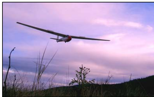
Ka 8b LN-GCZ med Ole Vidar bak spakene

fordelt på 4 piloter og med lengste tur på 28 minutter. Best høyde i vinsjstarten i dag blir ca 500 meter. Dagen avsluttes med demontering av fly og klargjøring av vinsjen for hjemtransport. En flott avslutning på en lang sesong. I løpet av 5 korte høstdager har vi produsert 60 vinsjstarter fordelt på 5 av klubbens medlemmer. Vinsjen har fungert utmerket og eneste hendelse er ett bruddstykke som røk i avgang. Vi har fått testet at vinsj og utstyr fungerer og vinsjen er nå fraktet tilbake til Rygge Flystasjon hvor den er lagret. Vi har også fått prøvd vinsj som startmetode på Lunde også dette uten problemer.