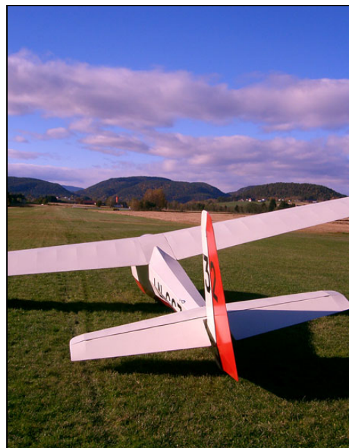
Ka 8b LN-GCZ

Etter en 6 timers kjøretur fra Stavanger til Lunde i Telemark på lørdagen var jeg endelig framme. Her er det masse folk, mange fly og slepene kommer som perler på en snor. Fantastisk vær med andre ord! Etter en meget laber sommer som nesten regnet helt bort var det mange som ønsket å få seg luft under vingene igjen. Etter å ha gjennomført hele 20 starter var det på tide å tenne opp grillen. Mens fiskeørna kretset over Nomevann ble det fortalt mang en gammel seilflyhistorie på terrassen ved klubbhuset.