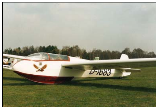
Messerschmitt Bergfalke II/55 LN-GIL

Det burde være kjent for de fleste av klubbens medlemmer at SHF etter hvert har samlet en god del historisk seilflymateriell. Utfordringen er hele tiden å skaffe egnede lagringslokaler. Et av stedene hvor vi har samlet en god del materiell er på gården Tangen i Våler Østfold. Her leier vi ca 170 m 2 og har kontrakt ut 2011. Etter en god del dugnadsarbeid fikk vi ryddet og klargjort rommet vi leier, og så startet arbeidet med og flytte flyene fra tidligere