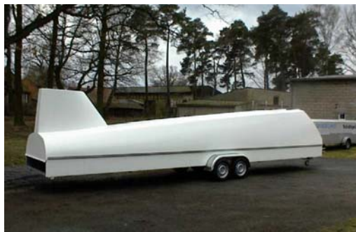
Seilflyhenger av merket Swan, Tyskland

Seilflyhistorisk Forening har i lang tid hatt behov for egen henger. Vi har sett på forskjellige typer seilflyhengere. Det som trengs er en stor universal henger som er stor nok til å romme de største flyene til klubben. Hengeren vil bli utstyrt slik at den kan frakte alle klubbens fly typer.