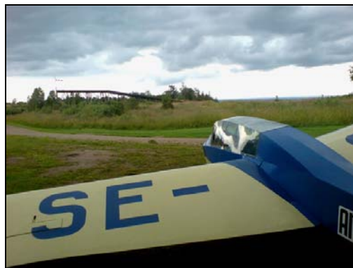
Bergfalke 2 ved startrampen for seilfly

Så var det "Linné på Ålleberg" dagen. Mye besøk fra byen og frem for alt flybart. SVS hadde Spechten, Sedbergh T21 og Kranichen på plass og fløy med dem. Vi hadde Lehrmeisteren og fikk vår plass-utsjekk. Fordi man ikke skulle fly over hangkanten p.g.a. turbulens, ble det noe uvant lave og korte innflyvninger. Dessverre fikk vi ikke prøvd noen av SVS sine fly, siden deres egne medlemmer fikk sine turer først. Endelig en fin dag.