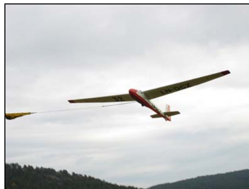
Ka8 b i vinsjstart

20-21.10.2007. Inspirert av suksessen 07.10. er vi tilbake på Lunde lørdag 20.10. Været på lørdag var lettskyet og med svak varierende vind. Dette resulterte i at vi måtte bytte baneretning midt på dagen.