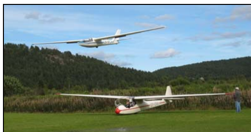
Lehrmeister er klar for start i Lunde

Sesongen 2007 har vært et relativt bra år selv om ikke Spechten har vært operativ. Spesielt gledelig er det at vi fikk i gang vinsjen og at dette resulterte i hele 60 starter på Lunde i oktober/november. SHF har operert Lehrmeister OY-DXK og Ka-8b LN-GCZ i 2007 sesongen. Totalt har 18 piloter fløyet i sesongen 2007